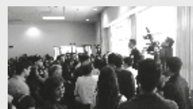
Apoyo a la sociedad