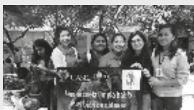
En el cuidado del Medio Ambiente